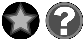
デザイン風にする